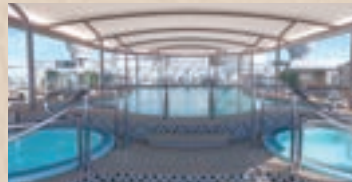
コンシェルジュ・プール