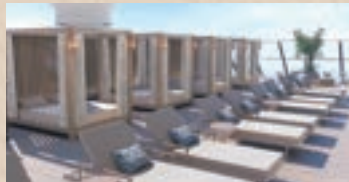
コンシェルジュ・サンデッキ

広々とした専用サンデッキでは、心地よいデッキチェアでくつろいだり、ジェットバスでリラックスしたり、日陰付きプールでゆったりと過ごしたり…。前方に広がる壮大な海のパノラマとともに楽しみください。