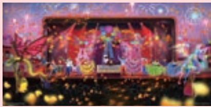
7 エリア ウォルト・ディズニー・シアター

全く新しいライブショーが開幕します。愛らしいキャラクターたちや、陽気なカモメの案内役「ティッピー・ブルー」と一緒に、冒険の旅へ! 魅力的な音楽、美しい映像、喜びに満ちたひとときとともに、海の魔法、想像の力、そして本当の友情を発見しましょう。