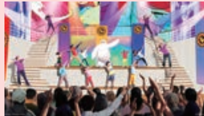
1 エリア ガーデン・ステージ

ウェイファインダー・ベイで、ゆったりくつろぎながら、モアナの物語を描いたミュージカルをお楽しみください。この感動的なショーは、音楽やダンス、人形劇、水の演出で、モアナの勇気、自分探し、友情に満ちた壮大な冒険の旅を描いています。