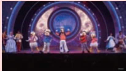
7 エリア ウォルト・ディズニー・シアター

映画「ウォーリー」のロボットたちが主役の、愛と憧れの物語。この新しい感動のミュージカルは、『リメンバー・ミー』『リトル・マーメイド』『アラジン』などのヒーローたちが、音楽と希望、大切な思い出の力で「イヴ」の記憶を取り戻そうと奮闘する物語です。