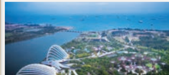
シンガポール湾とガーデンズ・バイ・ザ・ベイとフラワードーム

注1)クルーズ船は7:00着岸後、準備が整い次第、下船のご案内となりますので、時間を要します。 注2)成田・中部・福岡発の方は、下船後、空港へお送りし、アーリーチェックイン及び荷物預け後(24時間前から可能)、自由行動となります。 注3)便宜上、機内泊としています。成田・中部・福岡発着の復路:シンガポール発は、23:55～日付を超えた01:20となります。