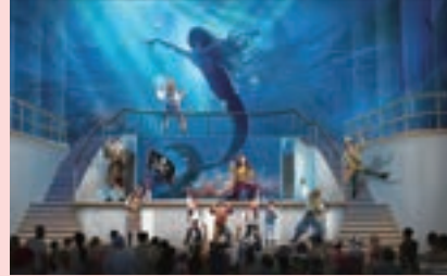
1 エリア ガーデン・ステージ