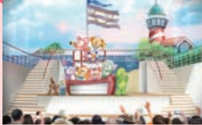
1 エリア ガーデン・ステージ