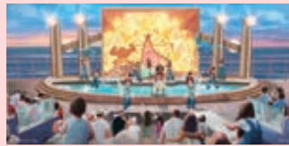
5 エリア ウェイファインダー・ベイ

悪名高くも魅力的なキャプテン・ジャック・スパロウや海賊仲間たちと、まばゆいばかりの宝物を求めて、壮大な冒険の旅へ出発! そして、LEDスクリーンに現れる巨大な海の魔女・セイレーン・クイーンとの対決が幕を開けます!